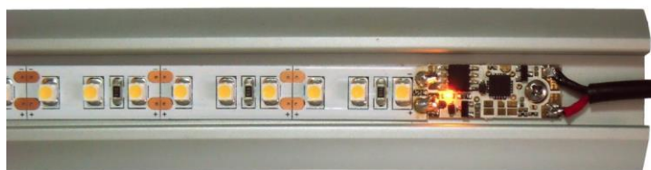
Obr.1 - Ukázka instalace do profilu

Miniaturní stmívač/spínač je svou konstrukcí určený k vestavění do ALU profilů s LED pásky, kde profil slouží zároveň jako dotykový senzor. Funkce soft start/stop šetří oči, poslední nastavenou úroveň osvětlení si pamatuje i při přerušení napájení. Umožňuje provoz ve 4 režimech, které jsou popsány podrobněji níže. Nabízí ideální řešení snadného ovládání svítidla pro kuchňské linky.